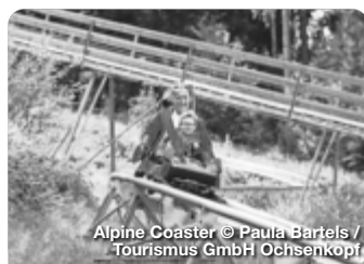
Alpine Coaster

Längst gilt die Therme als mehrfach ausgezeichnete „Perle“ der Fränkischen Schweiz. Das mineralhaltige Thermalwasser kommt aus Urtiefen des Juragesteins. Das Wasser belebt und entspannt zugleich. An der Therme 1, Mistelgau-Obersees