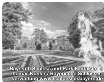
Bayreuth Schloss und Park Fantaisie © Thomas Köhler / Bayerische Schlösserverwaltung www.schloesser.bayern.de

TreffpunktDeutschland.de/bayreuth-region