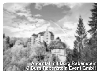
Ahorntal mit Burg Rabenstein