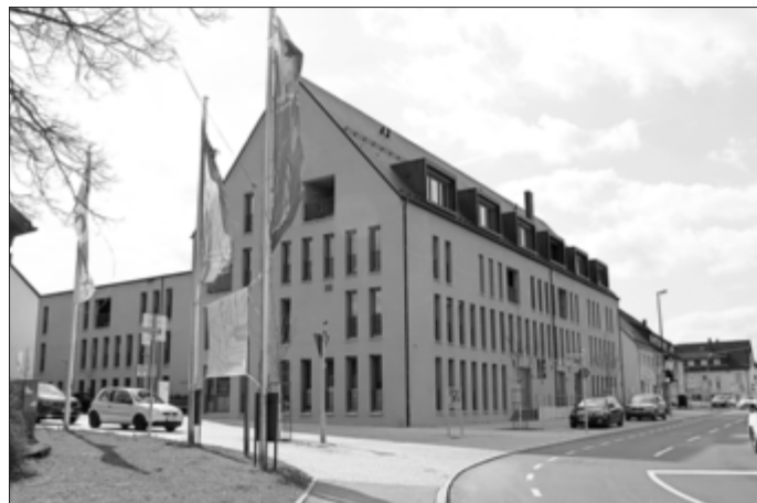
Von außen ist das Olga und Josef Kögel Haus geprägt von moderner Architektur, drinnen wird eine familiäre Atmosphäre gelebt.

In Vorträgen vermittelten die Fachkräfte des Olga und Josef Kögel Hauses zudem praxisbezogene Tipps zur Ernährung im Alter und zur Aromapflege in der häuslichen Versorgung. Als sehr hilfreich empfunden wurde ein Vortrag zum Thema Demenz. Hier erhielten Angehörige konkrete Tipps zur Gestaltung des Alltags, zur Förderung des Zugehörigkeitsgefühls und zum Umgang mit anstrengenden Verhaltensweisen. Beim Gedächtnistraining wiederum gab es heitere Gedichte und beschwingte Lieder zum Thema Frühling. Wer wollte, konnte den eigenen Blutdruck messen lassen oder sich mit Fachkräften über individuelle Fragestellungen austauschen.