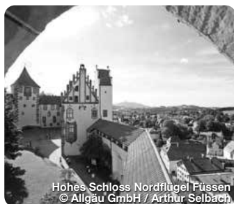
Hohes Schloss Nordflügel Füssen