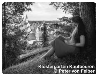
Klostergarten Kaufbeuren

Schlosspark im Allgäu Landkreis Ostallgäu Wie ein Schatzkästchen liegt er im Herzen des Allgäus, im bayerischen Süden Deutschlands. Er ist einer von neun Erlebnisräumen der Region und erstreckt sich über den gesamten Landkreis Ostallgäu, von Füssen über Pfronten, Nesselwang, Halblech, Marktoberdorf bis nach Kaufbeuren und Buchloe. Die königliche Gipfelkulisse aus Ammergau, Allgäuer und Tannheimer Bergen wachen wie steinerne Riesen über mystische Seen, rauschende Flüsse, sanft gewellte Hügelmeere und sattgrüne Wiesen, zwischen die Dörfer und historischen Städte eingebettet sind. Die archaische Poesie der Landschaft wirkt wie ein großer, weiter Park, der sich vor den vielen Schlössern und Burgen der Region ausbreitet, vor allem zu Füßen des Märchenschlosses Neuschwanstein. TreffpunktDeutschland.de/ostallgaeu