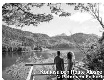
Königsalpen Route Alpesee