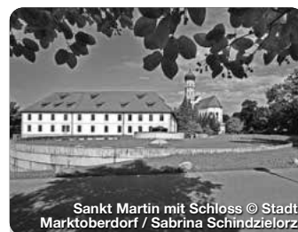
Sankt Martin mit Schloss Marktoberdorf

Eine Stadt mit Mittelaltercharme, vielen Sehenswürdigkeiten und einem bunten Veranstaltungsmix. Eindrucksvoll ist der Spaziergang auf der um 1200 erbauten Stadtmauer zwischen der spätgotischen St. Blasius-Kirche und dem Fünfkopfturm. TreffpunktDeutschland.de/kaufbeuren