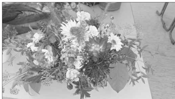
Blumengesteck – im Unterricht selbst hergestellt

Krumbach – Den Haushalt führen müssen wir alle und oft ist im Alltag neben Beruf und Familie nicht mehr viel Zeit dafür. Wie die Haushaltsführung nachhaltig, rationell und damit zeit- und ressourcensparend funktionieren kann, lernen Sie im Teilzeitstudiengang für Ernährung und Haushaltsführung an der Landwirtschaftsschule Abt. Hauswirtschaft.